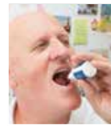
ENKELT: Tre dråper under tunga fem ganger om dagen gjorde underverker.